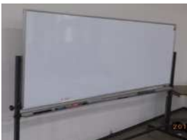
ホワイトボード：正面左側