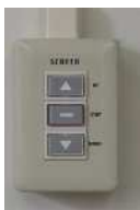
電動スクリーン：黒板横壁