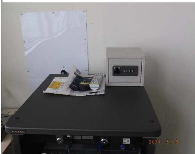
正面ホワイトボード左側