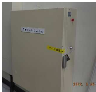
正面黒板左側壁面収