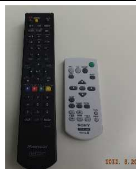
左: Blu-rayプレイヤー用リモコン 右: プロジェクター用リモコン