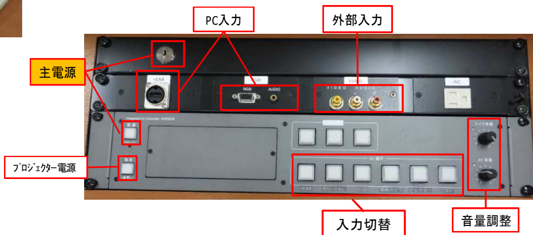
操作パネル・入力端子