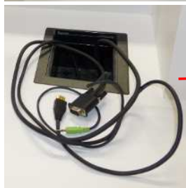
モニター (タッチパネル)