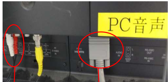
音声ケーブル (赤・白)