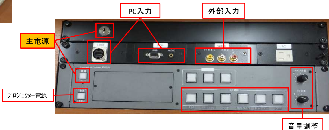
操作パネル・入力端子