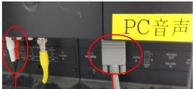
音声ケーブル (赤・白)