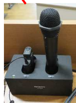
ピンマイク・ハンドマイク ※使用後は、必ず充電スタンド に戻し、充電ランプ(赤)が点灯 していることを確認してください。