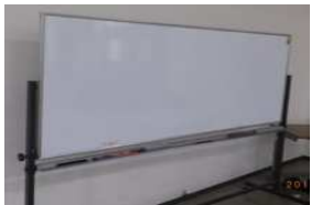
ホワイトボード: 正面左側