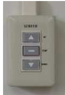
電動スクリーン: 黒板横壁