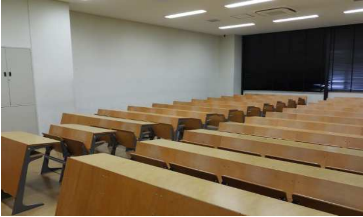
前方入口付近から