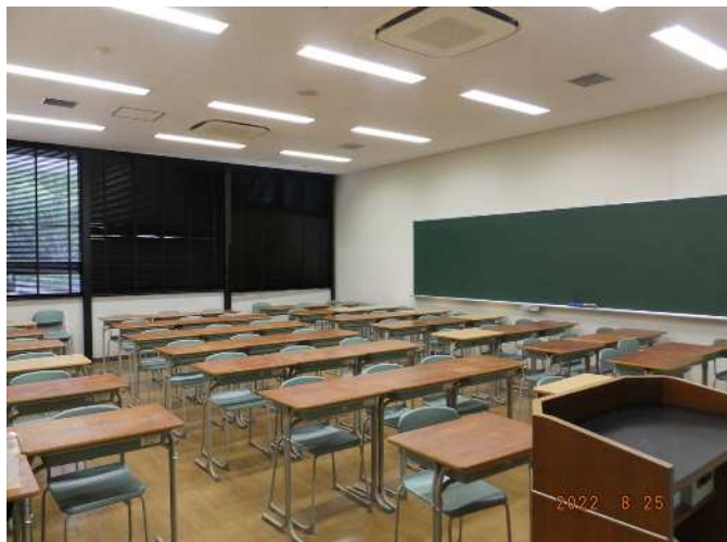
前方入口付近から